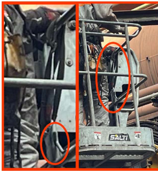
Longe non attachée au point d'ancrage