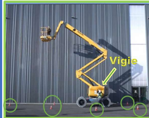
Balisage tout autour de la zone de danger