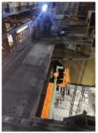
29 Mai 2024 Aciérie Pont 548 30 mètres