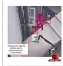
29 Mai 2024 Energie / Dunkerque Conduite gaz 7 mètres Il est sorti de la nacelle (non respect du MOS)

Attendus pour chacun : A chaque réunion Quotidienne, A chaque prise de poste, Avant chaque intervention.