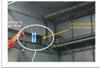
29 Mai 2024 Logistique / Halle 06 17 mètres