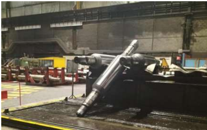
Chute d'un cylindre lors d'une manutention au pont à Florange Ebange le 30 Octobre 2024

Minute sécurité Je reste hors de la zone de danger